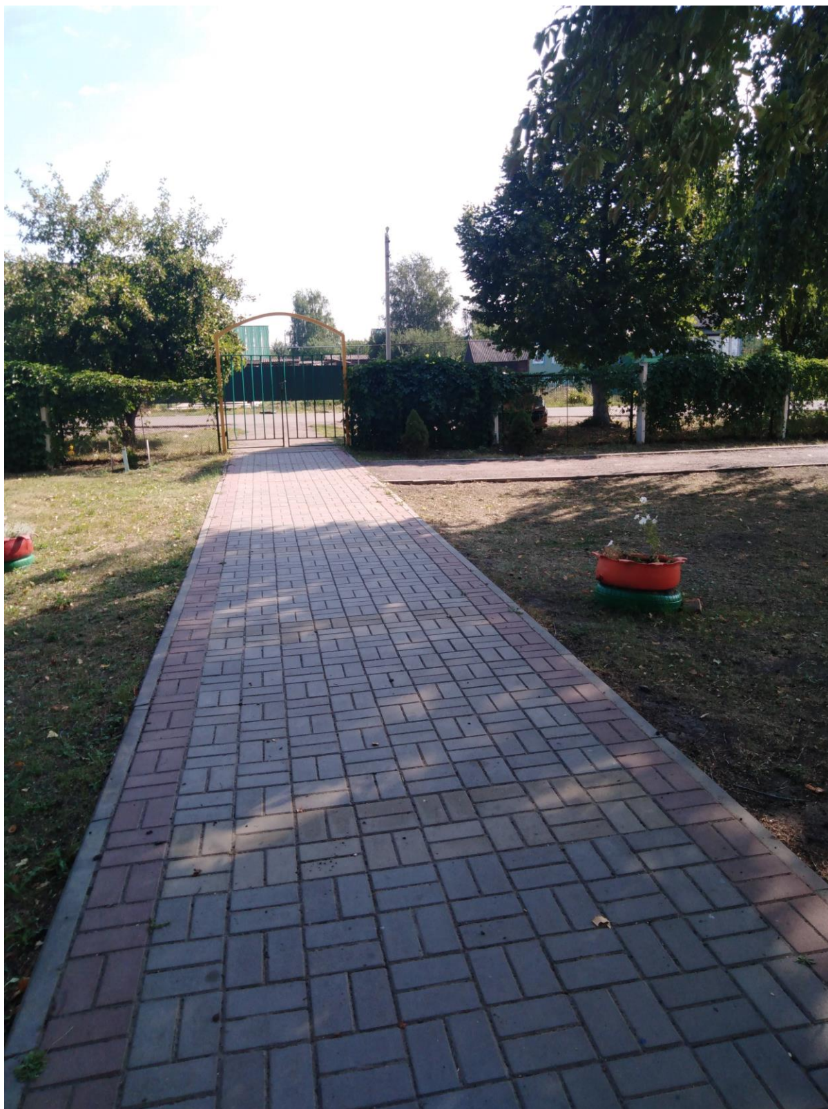
Фото 1. «Вход на территорию МБДОУ ЦРР – ДС»